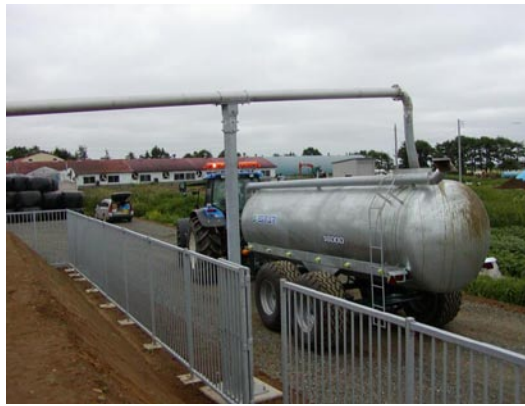
施設の使用状況（スラリー（液肥）散布）

排水路は、水質を浄化する遊水池や土砂緩止林（植樹）などの整備を、右支二姉別川排水路から順次進め、今後は、左支姉別川排水路の整備を予定しています。