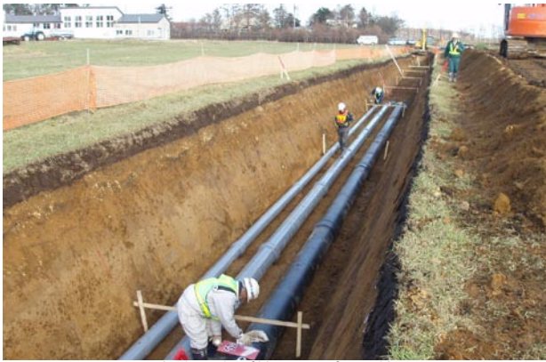
用水路工事（管の設置）の状況

用水路は、平成二十一年度で全ての整備と必要な機能確認などの試験を終了し、全て完了しました。