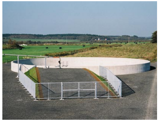
完成したスラリー（液肥）の配水調整槽