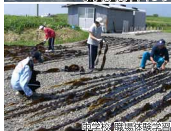
中学校 職場体験学習