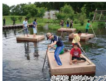
小学校 校外キャンプ

さらに、体育の授業の充実をはじめ、姉別南地区合同運動会、マラソン大会、スケート大会、縄跳び検定の取り組みなどを通して体力づくりを推進しています。また、健康・教育相談活動や相談結果の公表と交流などを推進しています。