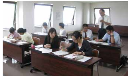
指導力向上研修に取り組む先生方

☆浜中町教育委員会では、全ての子どもたちが充実した学校生活を送ることができるよう、生活習慣の基盤である「早寝、早起き、朝ごはん」の実践を奨励しています。