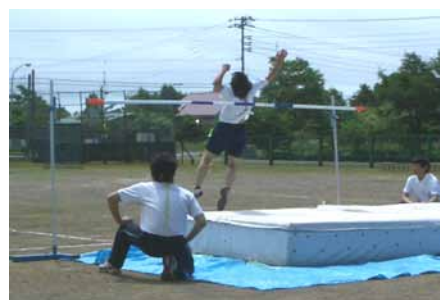
走り高跳びの記録に挑戦する生徒

日頃の体育活動で身に付けたたくましさを発揮し合う場になっており、目標に向かってみんなで励まし高め合おうとする生徒同士や生徒と先生の一体感が表れている素晴らしい体育祭でした。