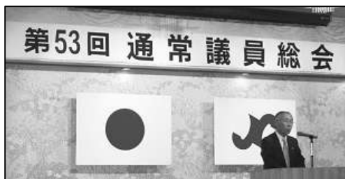
(総会での木賀会頭挨拶)

平成十八年度の日本の経済は、全体的には「いざなぎ景気」を越える戦後最長の景気拡大が続き、高収益を上げる企業が増え、好景気の一年でありましたが、こうした景気の拡大が必ずしも勤労者の所得向上にはつながらず、個人消費が大きく伸びることはないという状況になりました。