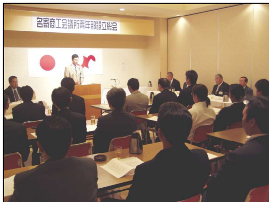
当所青年部設立総会の様子