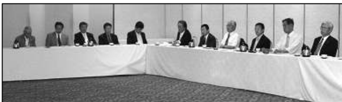
(総会の議案を審議中)

名寄市においては、道立公園サンプラザが一部開園し、また、名寄バイパスは智恵文インターまで開通するという明るい話題がありました。